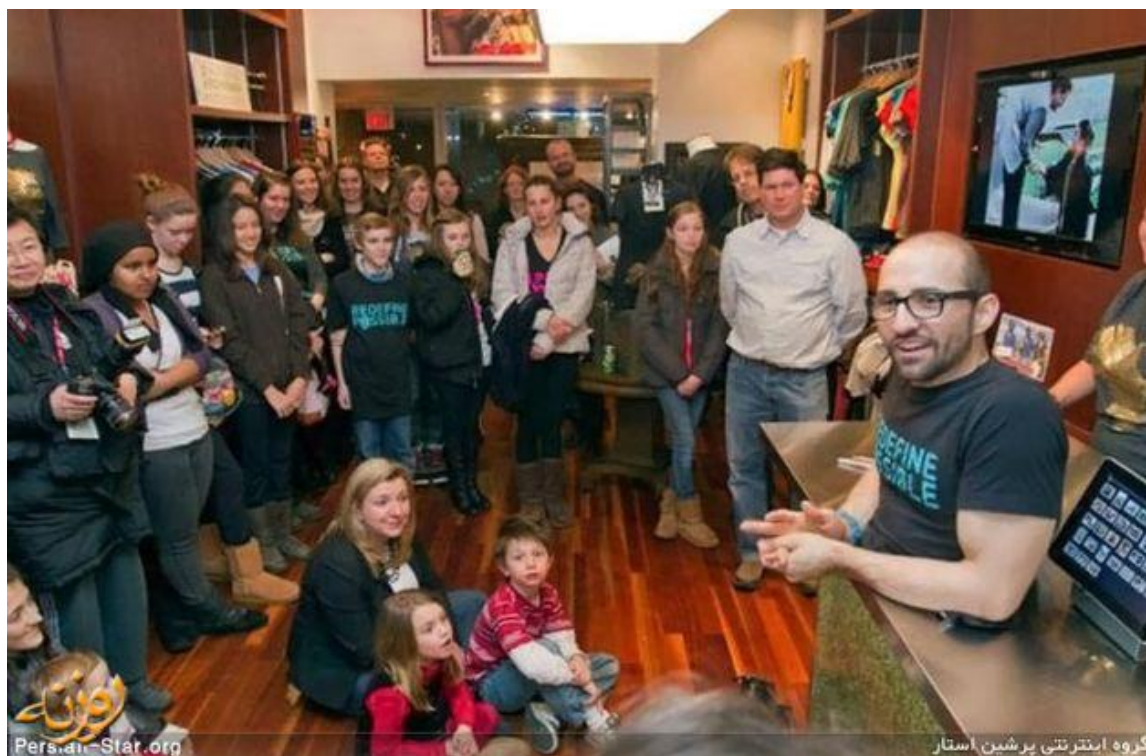
گروه اینترنتی پرشین استار